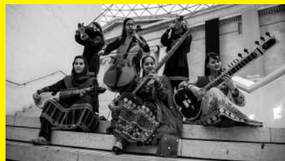
2019, Orchestre Zohra , orchestre féminin de l'Institut National de Musique d'Afghanistan en tournée en Suède @ANIM.