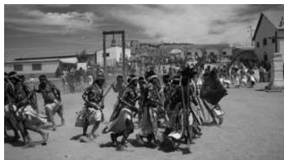
Danse des Tarahumara contre l'extractivisme @Sylvie Marchand.