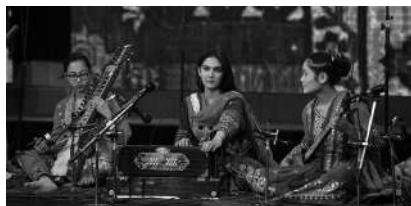
Kaboul, 2019, Concert de Gala des orchestres de l'ANIM @ANIM.

Informations & réservations : auprès de la mairie de Baigorri.