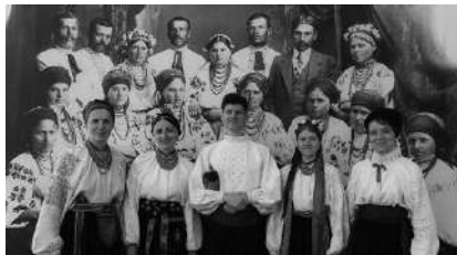
L'ensemble vocal du Musée Ivan Honchar, Kiev, Juillet 2022

15€ tarif normal - 8€ tarif réduit - Gratuit (- de 12 ans)