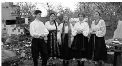
Oï Dolyňa chantée dans les décombres de la guerre d'Ukraine.