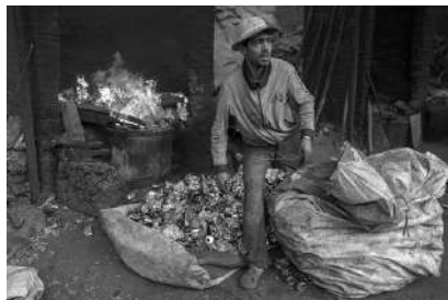
Le Caire, Égypte, février 2017. Auteur : P. Garret , terrain réalisé avec B. Florin.

Les images des récupérateurs de déchets dans les rues ou dans les décharges mettent souvent en scène des personnes travaillant dans des conditions dégradantes, peuplant des paysages dantesques et évoquant une misère humaine. Cette exposition interroge les rapports qu'entretiennent les sociétés avec leurs déchets dans le monde. Ce programme de recherche intitulé Sociétés Urbaines et Déchets (SUD) s'intéresse aux déchets en tant que révélateurs de dynamiques plus larges touchant les sociétés urbaines.