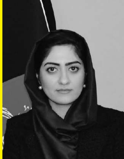
Mme Parwana Paikan , Ministre Conseillère auprès de l'Ambassade de la République islamique d'Afghanistan en France.

Elle est aujourd'hui Ministre Conseillère auprès de l'Ambassade de la République islamique d'Afghanistan en France. Elle entend porter la voix des femmes et des filles afghanes pour qu'elles ne perdent pas espoir.